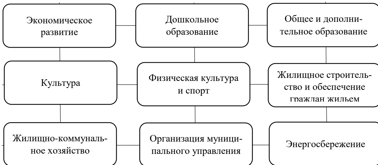
Рисунок 2 – Система показателей для оценки уровня экономической безопасности муниципального образования

По каждой группе показателей отобраны по три наиболее характерных для данной сферы. Также должен быть соблюден принцип сопоставимости показателей с нормативным уровнем.